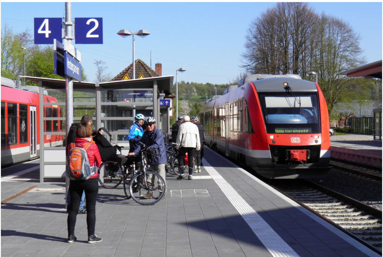
Radwanderer beim Umsteigen im Knotenbahnhof Herzberg am Harz